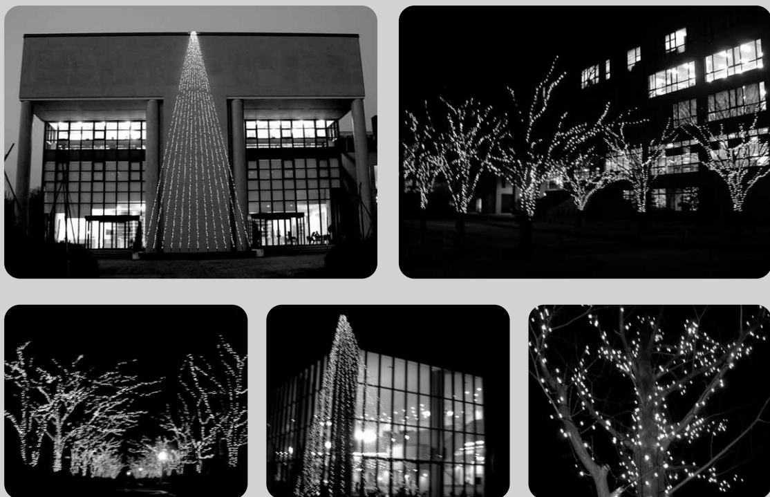
お見積りに関しましては、設置場所、設置条件等により大きく異なりますので、別途ご相談ください。