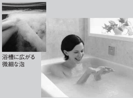
浴槽に広がる微細な泡

スイッチを入れると、ノズルから酸素の泡が放出。微細な泡が約2分で浴槽いっぱいになり、ミルクィのような白いお湯になります。酸素たっぷりのお湯がお肌の角質層にまで届くのでお肌しっとり。モイスチャー効果を実感いただけます。また、お湯のぬくもりを身体の内側まで伝えるので、入浴後の湯冷めもしにくくなります。