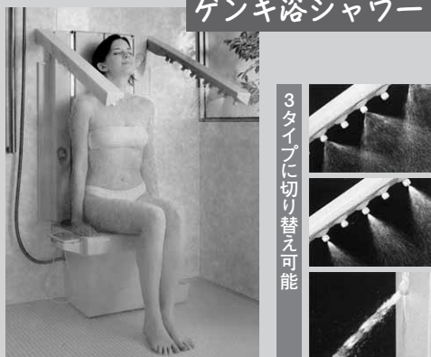
3タイプに切り替え可能

さりげない優しさにあふれた浴室空間 隅々にまで安全に配慮 だれもが安心してご利用いただけるように、「イーユ」には安全に配慮した様々な機能が散りばめられています。