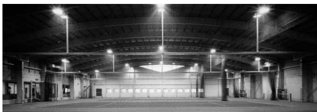
▲内部:アーチ屋根タイプ