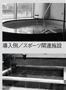
導入例/スポーツ関連施設

「くすりを飲まなくても血圧が安定するようになりました。」 「接骨院通いが不要になりました。」 「足のかかとの角質がすごかったんですが炭酸泉に入ると角質が取れて柔らかくなりました。感動モノ!」 「冷え性も良くなったし、体重が2キロおちたんです。」