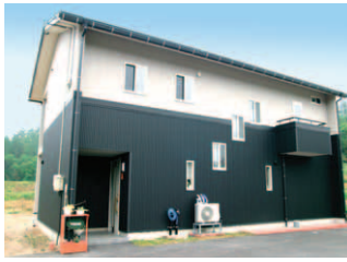
▲右上が喫煙バルコニー。