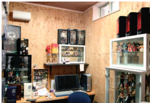
▲フィギュアが並ぶ趣味の部屋。