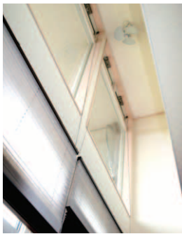
▲シーリングファンが回る吹き抜け。