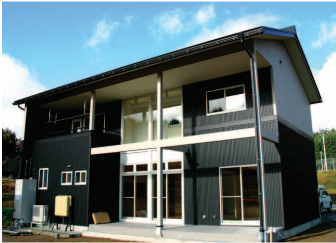
▲黒の外壁が落ち着いた雰囲気を醸し出すS邸。