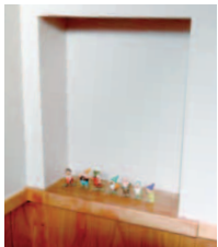
▲トイレにもニッチ。