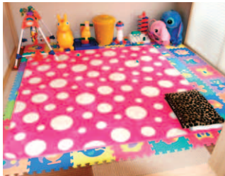
▲LDKの横に設けられた和室。