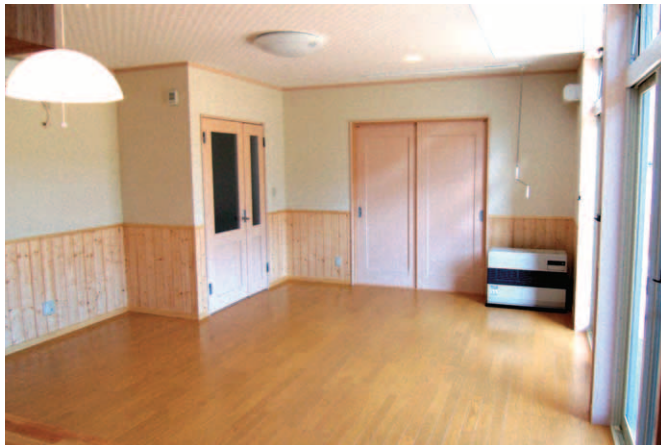
▲腰板のバイン材とフローリングが暖かな雰囲気を伝える。