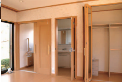
▲折れ戸を採用した全開放の洗面所(中央)。明るく、清潔感漂うトイレ(左)。