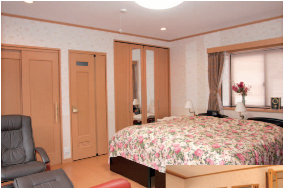
▲南北からの採光で明るい洋室(11帖)。フローリングに大型ベッドを配置。窓の横にはテーブルと椅子。

増築にあたり、1さんご夫婦が強く希望したのは、二人でのんびりとくつろげる暖かい部屋。「これまでの寝室は狭くて、採光も不十分で寒かつたんです。とにかく、暖かい部屋に」とご主人。八十歳を超えながらも車の運転や陶芸などを楽しむ、お元氣なご主人だが、歳とともに夜間にトイレに立つ回数も増え、寝室にトイレがあればとも以前から願っていたという。