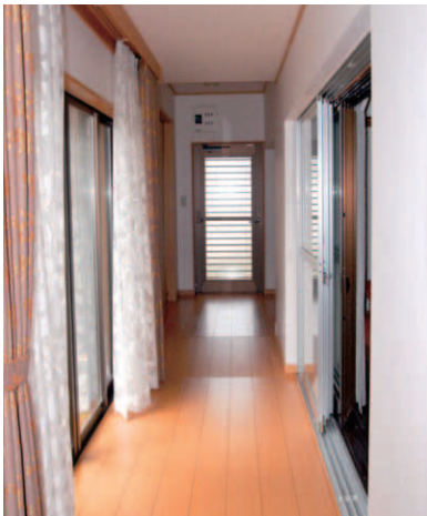
▲母屋と増築部分をつなぐ渡り廊下。以前の寝室は窓のサッシごと残した。