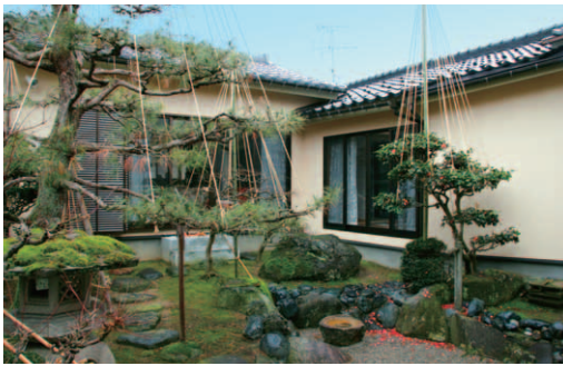
▲増築部分は、中庭に面した離れ風のつくり。