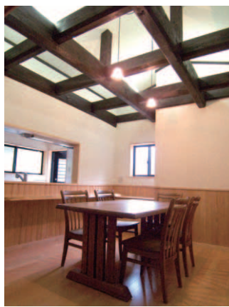
▲天井を張らず、屋根の勾配と梁を見せたダイニング。