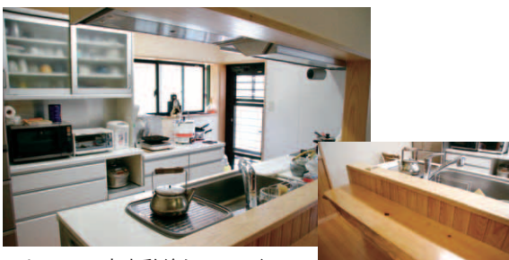
▲キッチン家事動線もスムーズ。