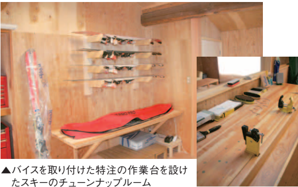
▲バイスを取り付けた特注の作業台を設けたスキートのチューンナップルーム