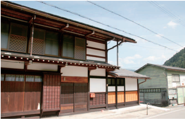
▲昭和初期に建てられたM邸は、山間地の風雪に長年耐えてきた。右はチューンナップルームを設けた納屋。

まず、玄関脇の真新しい白漆喰と木の腰板が目を引く母屋へ。外観は古民家の味わいを残しつつ、建物の三分の一ほどに手が加えられている。玄関に入る