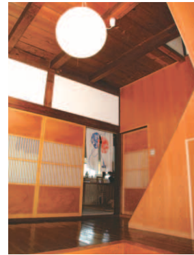
▲古民家ならではの温もりが感じられる玄関。

と、訪問者をやさしく迎えてくれる木の温もり。懐かしさと新しさを融合させた手技が見事といえる。