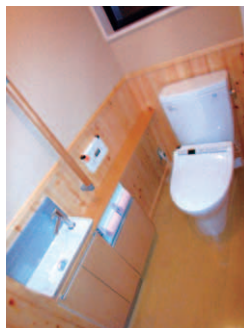
▲ヒノキの香りに満ちた水洗トイレ。