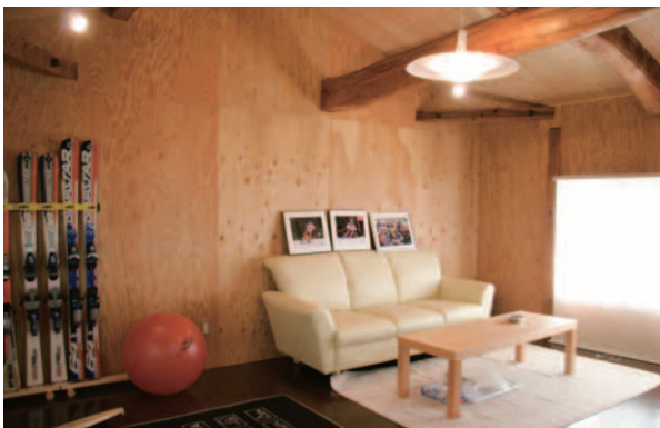
▲チューンナップルームの横に設けられたルームにはソファが置かれている。

に作業の様子を眺めることもできる。天井を見上げると、梁がそのままに。「天井を外すと三本の梁が現れたので、これを部屋のアクセントにしました」と施工担当者。既存のいいものを活かしながら、新しいアイデアを加え、住みやすくしていこうとする姿勢。ここにリフォームの原点を見る思いがした。