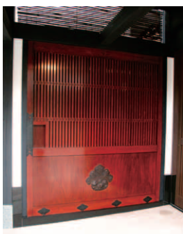
▲金具にもこだわった趣きのある蔵戸。

店舗の正面に立つと、外から店内のギャラリーが見える。あたたかも、窓枠をフレームとした一枚の絵のよう。「店舗のガラスをキャンパスに見立て