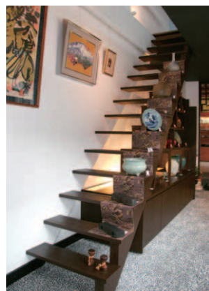
▲階段を展示棚にして広がりとお興行きを演出した店内。