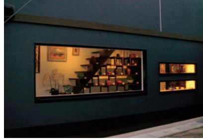
▼黒漆喰風の壁に設けられたフレームギャラリー。