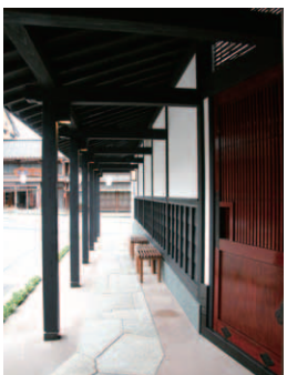
▲町並みに調和する石畳の回廊。