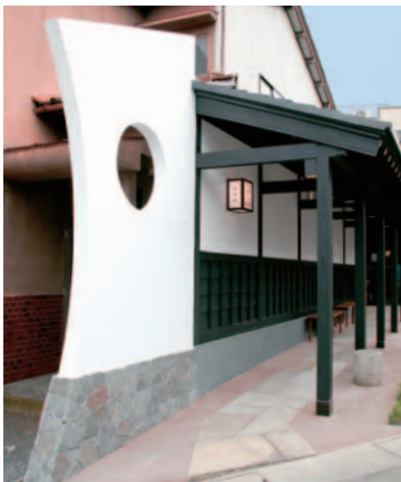
▲お店のマークに三日月を用いたことから、回廊入口のモニュメントには満月をとり入れ、風抜き穴としても機能させている。

モニュメントあり、石畳あり、小笹の植性なののに、町並みの景観を決してそこなわないデザイン。二・五メートル×十九メートルの細長い敷地を上手く利用した。魅力的に装ったこの回廊は、通りを往来するひとの目を留めさせ、足を止めさせ、ギャラリーへといざなう力を発揮することだろう。