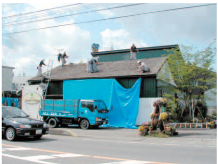
▲屋根の補修メンテナンス工事 店舗総合保険により即座に対応。