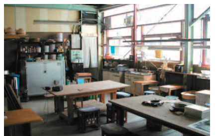
▲陶芸工房内 リフォーム後 担当者の提案で陶芸工房を誘致。陶芸と花を通じた地域交流の場として注目された。