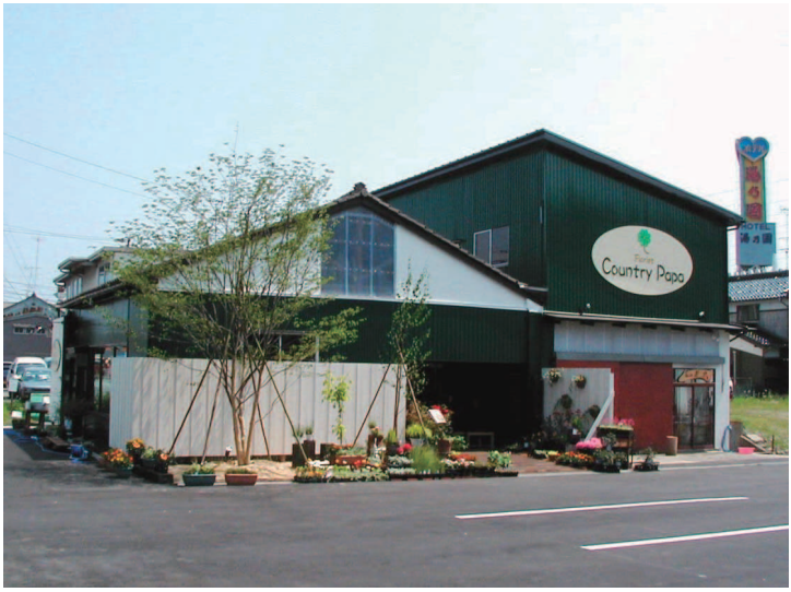
▲リフォーム後 左の棟が花屋、右の棟は陶芸工房。

目指す店舗は、お客様が自然と笑顔になるお店。相談を受けた担当者は、マーケティングや不動産など幅広い知識を