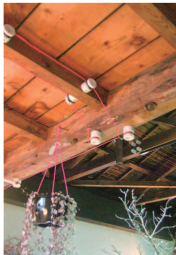
▲白色の物体が碇子。赤色が電線。 電線は碇子で固定され、屋根下を張りめぐっている。