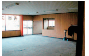
▲花屋店内 リフォーム前

担当者が紹介した物件は築五〇年になる木造の空き家。昔なつかしい雰囲気を活かして穏やかな気持ちを引き出し、笑顔になってもらうというのだ。昔の日本の民家に広く見られた「合掌造り」という構造で、屋根裏には木の皮が幾