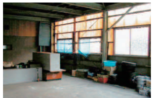
▲陶芸工房内 リフォーム前