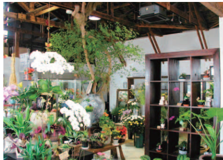
▲花屋店内 リフォーム後