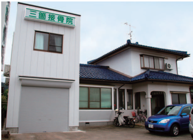
三箇接骨院と自宅の全景。左の白い2階建てが増築部分（上）。真ん中の平屋部分が診察室。改装前は、寄せ棟の屋根だった（左）。

「晴れの日が何日が続かないと屋根の解体ができないので、天気予報と進捗状況の摺り合わせが難しかったですね」と担当者は言う。