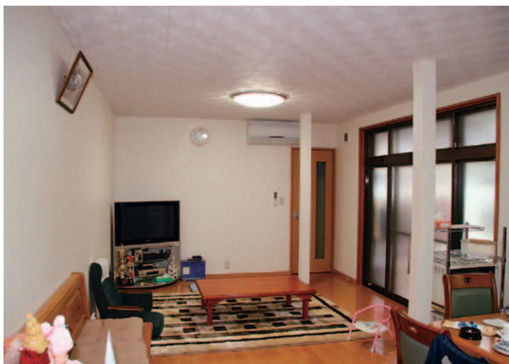
広がって、ダイニングとワンフロアになった居間（上）。右側のサッシを開けると、特別製のサンルームがある。屋根と一体となり、日差しも取り入れる（右）。