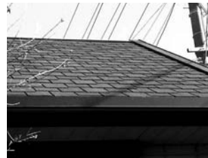
住宅屋根用平板石綿スレート

外壁材や屋根材は割れることがない限り、アスベストが飛び散る可能性は低いと考えられます。