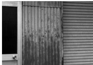
石綿スレート(波形)