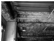
耐火被覆材(梁)